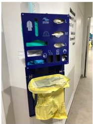
Méphi-Box fixe sur rail din ref : Méphi-Box 001