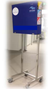
Méphi-Box mobile sur charriot ref : Méphi-Char 003