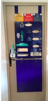
Méphi-Box Support porte de chambre ref : Méphi-Sup 002