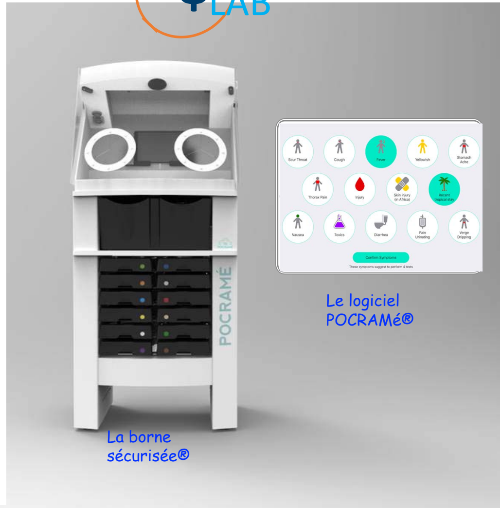
La borne sécurisée®

Ces tests doivent permettre de répondre à 3 questions cruciales : ✓ Le malade doit-il être hospitalisé ? ✓ Doit-il être isolé car contagieux ? ✓ Faut-il débuter un traitement anti-infectieux en urgence ?